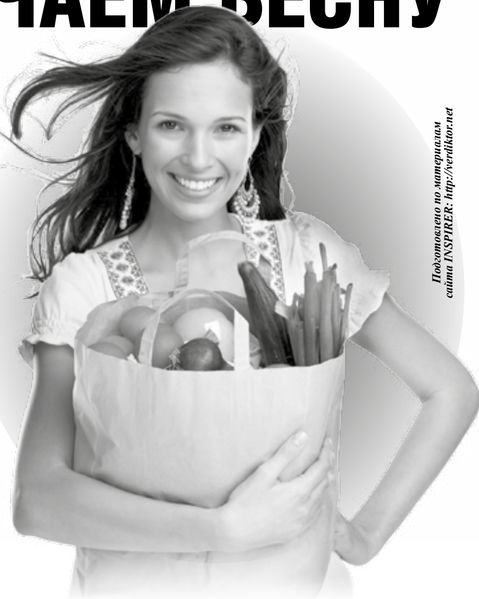
Подготовлено по материалам сайта INSPIRE: http://verdikt.net

Вместе с домашними заботами нужно заняться и физической подготовкой. Наступает пора обновлять гардероб, но убирать не только теплую одежду, но и лишние килограммы. «Чтобы подбородки не раскачивались на ветру, живот не тянул к земле и осанка не выглядела, как вопросительный знак», добрые люди советуют делать зарядку – это не только улучшит Ваш физический облик, но и эмоциональное самочувствие, сделает Вас более активными и организо-