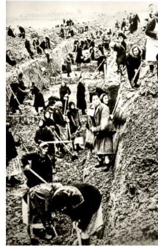
Строительство оборонительных сооружений

В июне 1941 г. исполком Ленинградского горсовета привлекает жителей города и пригородов к строительству оборонительных сооружений. С июля по декабрь 1941 г. на строительстве работало 476 тыс. человек.