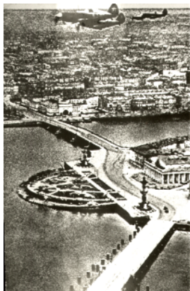
Самолеты -истребители баражируют над городом

Немецко-фашистское командование пыталось сломить сопротивление защитников города бомбардировками с воздуха и обстрелом тяжелой артиллерией, с этого дня бомбардировки и обстрелы не прекращались ни на один день. Всего за все время осады Ленинграда фашисты обрушили на город 102 520 зажигательных и 4 653 фугасных авиабомб, выпустили около 150 тыс. снарядов. Было убито 16 747 и ранено 33 782 мирных жителя, разрушено свыше 3 тыс. и повреждено свыше 7 тыс. зданий. Но враг не сломил боевой дух защитников города. Враг столкнулся с непредвиденными трудностями. Более 40 отборных дивизий, топтавших коваными сапогами мостовые Белграда, Афин, Варшавы, Осло, Парижа и других европейских столиц, неожиданно для себя