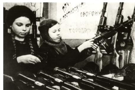
Вклад детей в общее дело Великой победы

картон, мяса и мясопродуктов на - 30 суток; жиров - на 45 суток; кондитерских изделий и сахара - на 60 суток, а жители города продержались 900 дней!